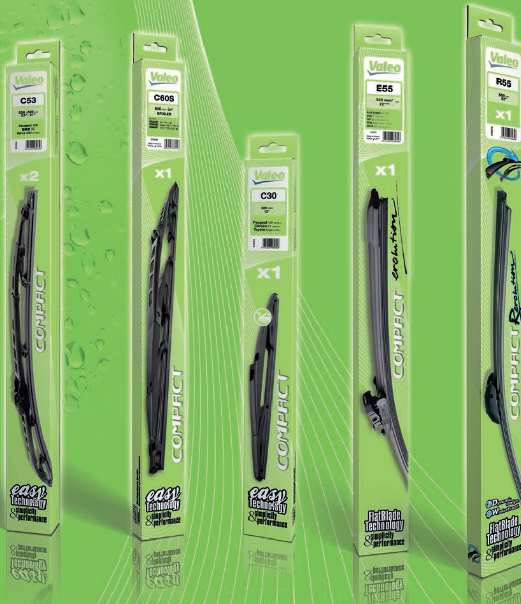
Compact X2 Conventional 22 Part numbers

L'alliance de la simplicité et de la performance : Une gamme spécifiquement créée pour l'aftermarket